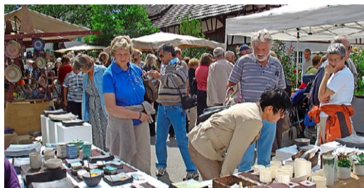
Stöbern am Iznanger Töpfermarkt.

Dieses Jahr findet der Töpfermarkt auf dem Parkplatz des Sportgeländes Mooswald in Iznang (DE) am Bodensee statt. Parkplätze für Besucher sind speziell ausgewiesen. Nun sind sie wieder da, 70 Keramiker aus den verschiedensten europäischen Ländern. Der Besucher findet klassisches Gebrauchsgeschirr, edle Gefäss- Unikate, ausgefallene Skulpturen, Baukeramik und Kachelöfen, junges Porzellan-Design und vieles mehr für das anspruchsvolle Zuhause. Auf dem Töpfermarkt gelten die für diesen Tag die aktuell ausgewiesenen Hygieneregeln. Weitere Infor-