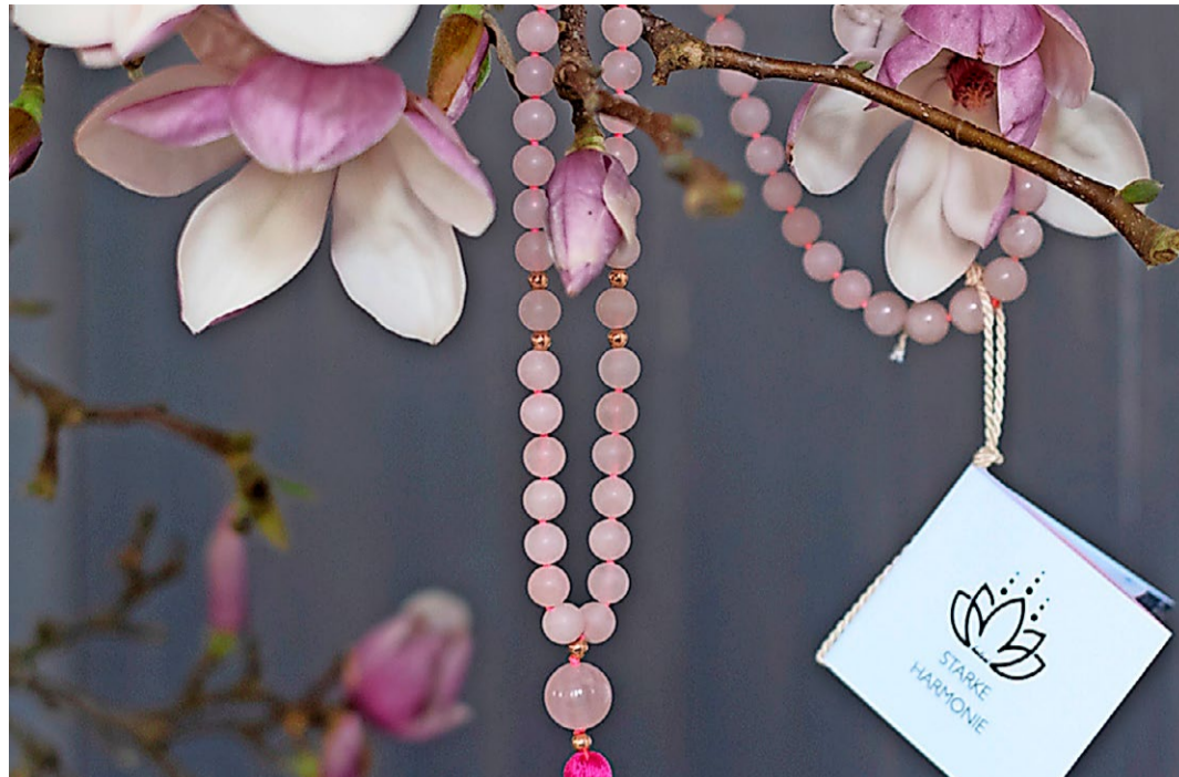
Entdecken Sie mystische Schmuckwelten. z.V.g.

Dimovera Nachlasstreuhand Oberer Graben 2, 8400 Winterthur