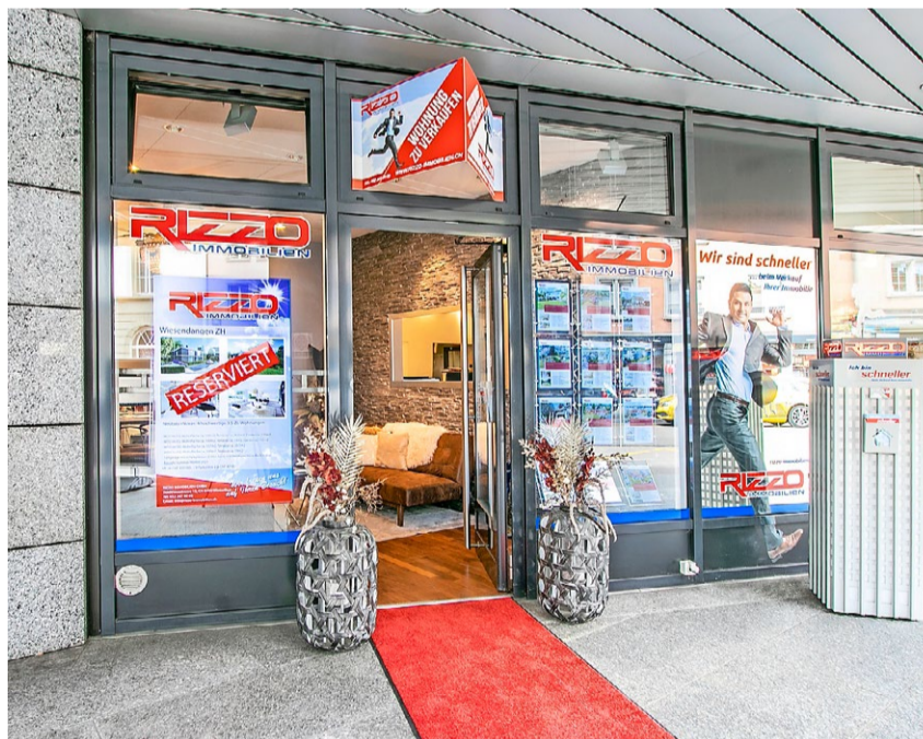
Auch für spontane Passanten steht die Türe zum RIZZO Immobilien-Shop stets offen.

Kurztrips von Zuhause aus, stehen auch diesen Sommer hoch im Ferien-Trend. Weshalb also nicht mal einen Altstadt-Einkaufsbummel in Winterthur mit einem Besuch des RIZZO Immobilienshops verbinden? «Unser Ambiente, verbunden mit einer feinen Tasse Kaffee, versprüht auch etwas Ferienstimmung», verspricht Gabriele Rizzo. Und wer weiss, vielleicht findet sich unter den tollen Angeboten – einen Ausschnitt davon zeigen wir Ihnen auf dieser Seite – eine auf Sie zugeschnittene Immobilie. So gesehen steht möglicherweise schon bald ein Ausflug mit Besichtigung in Seen, in Seuzach oder in Eglisau