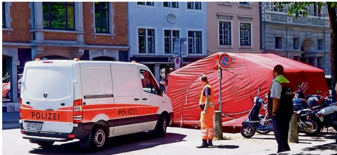
Nach dem tödlichen Unfall sperrte die Polizei die Stadthausstrasse zur Spurensicherung.